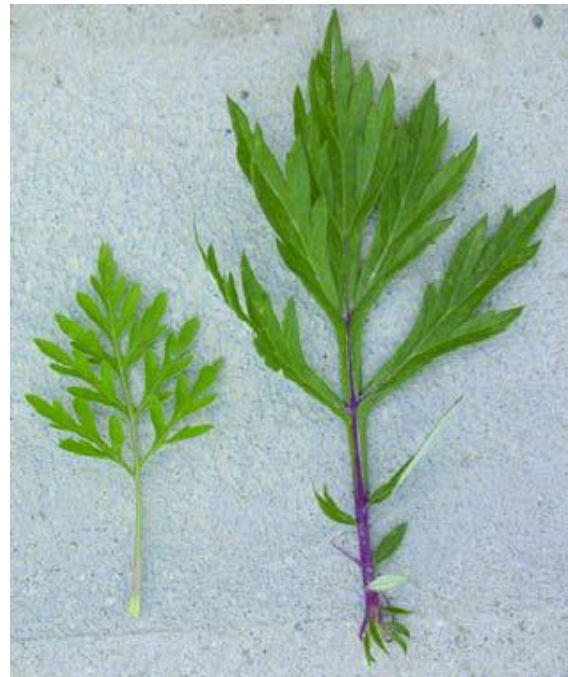
Foglia pagina superiore